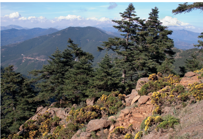
Figure 3. Abies pinsapo var. pinsapo dans la Sierra Bermeja (Espagne du sud)

Il est enfin pertinent de mentionner le rôle évolutif que risque de jouer l'hybridation interspécifique dans le futur. La plupart des espèces présentes dans les régions tempérées européennes, ont des espèces apparentées (appartenant au même genre) en région méditerranéenne, avec lesquelles elles ont maintenu la capacité de se croiser (fig.3). Par ailleurs les contacts entre espèces méditerranéennes et tempérées auront tendance à être plus fréquents dans les prochaines décennies, suite à la migration stimulée par le changement climatique. A l'instar des contacts interspécifiques qui ont été restaurés lors du dernier réchauffement postglaciaire, on peut donc raisonnablement anticiper sur des