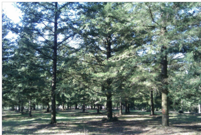
Figure 4. Verger à graine de clones de douglas de la Luzette (Lot)

Il doit en effet, autant que possible, armer les peuplements d'arbres cultivés contre les divers aléas qu'ils subiront pendant leur vie (sécheresses, tempêtes, fortes gelées et canicules, attaques parasitaires ...). Il doit évaluer le plus tôt possible des caractères qui s'expriment souvent à l'âge adulte (20 ans ou plus dans le cas des propriétés du bois). Compte-tenu du long intervalle de génération, il cherche à obtenir en une seule étape un gain génétique significatif sur différents caractères qui peuvent être parfois antagonistes (exemple : tardiveté du débourrement végétatif et densité du bois chez l'épicéa commun).