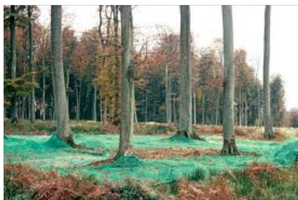
Figure 3. Filets au sol pour la récolte de faines en peuplement porte-graines de hêtre (ONF)

L'objectif de conservation est prioritaire pour quelques espèces : pour des raisons sanitaires pour les ormes décimés par la graphiose et les frênes communs fortement impactés par l'arrivée récente de la chalarose, ou pour des espèces d'intérêt particulier : cormier, alisier de Fontainebleau, pin de Salzmann . Dans le cas général, programme de conservation et réglementation des matériels forestiers de