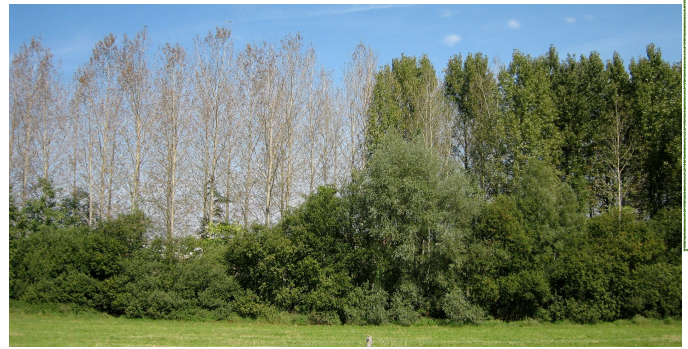
Figure 2. Exemple de variabilité génétique entre individus (clones) : sensibilité à la rouille foliaire du peuplier - les individus de gauche défeuillés ou aux feuilles brunes appartiennent tous au clone Beaupré très sensible aux variants du champignon pathogène porteur de la virulence 7, très fréquente en Europe. A droite, les individus du clone I-214, résistant à ces mêmes variants portent tous des feuilles encore bien vertes, pas ou très peu attaquées. - Source : J. Pinon

Le régime de reproduction allogame (la fécondation est préférentiellement croisée) de la très grande majorité des espèces forestières et la très grande taille de leurs populations favorisent le maintien d'une très grande variabilité génétique et phénotypique entre arbres d'une même provenance. Les caractères d'intérêt pour l'adaptation et la productivité sont souvent gouvernés par de nombreux gènes et présentent une variation continue. Les travaux de recherche conduits depuis les années 1960 sur de nombreuses espèces en utilisant les méthodes de la génétique quantitative ont permis d'évaluer la variabilité génétique et l'héritabilité (part des facteurs génétiques dans la variation de l'expression d'un caractère phénotypique mesurable) de très nombreux caractères. Cette héritabilité, clé de la sélection, peut être forte (par exemple pour la précocité de débournement au printemps et la densité du bois), moyenne (souvent pour la croissance en hauteur) ou faible (par exemple pour la rectitude du fût).