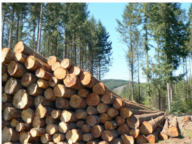
Figure 3. Améliorer l'approvisionnement des entreprises

Le contrat fait le constat du déficit d'investissements de l'amont à l'aval de la filière, et souhaite rompre avec le scénario tendanciel défavorable des dernières décennies, selon lequel la récolte stagne, la valeur ajoutée et les emplois diminuent, les exportations de produits bruts (grumes) augmentent, ainsi que les importations de produits à forte valeur ajoutée (papier, meubles, produits élaborés de construction). Il porte l'engagement des signataires de mettre en œuvre une stratégie interministérielle et interprofessionnelle, qui concourt à la réalisation des objectifs économiques et environnementaux de la France.