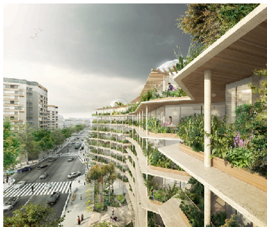
Figure 4. Développer l'usage du bois dans la construction

Cette stratégie vise le développement de la valeur ajoutée et des emplois de la filière forêt-bois en répondant aux marchés, notamment celui de la construction, et en valorisant la ressource française. Elle s'inscrit en cohérence avec les objectifs de la loi relative à la transition énergétique pour la croissance verte (LTECV), du Plan National Forêt Bois (PNFB), et du Plan innovation forêt bois 2025, publié en avril 2016, à la demande des ministères signataires du contrat et du ministère chargé de la recherche.