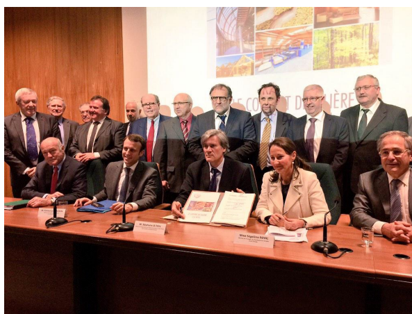
Figure 2. Signature du premier contrat de filière forêt-bois le 16 décembre 2014. Ségolène Royal, ministre de l'Ecologie, Emmanuel Macron, ministre de l'Economie, de l'Industrie et du Numérique, Stéphane Le Foll, ministre de l'Agriculture, de l'Agroalimentaire et de la Forêt, Sylvia Pinel, ministre du Logement et de l'Egalité des territoires et Alain Rousset, président de l'Association des Régions de France ont signé ce contrat avec les représentants professionnels de la filière

C'est pourquoi la filière forêt bois a été reconnue en 2013 filière d'avenir par le gouvernement, et intégrée, en tant que quatorzième filière stratégique nationale au CNI. Les ministres chargés de l'économie et de la forêt président ce comité stratégique du CNI, dont le président de France Bois Industrie Entreprises (FBIE) assure la vice-présidence; il réunit tous les acteurs de l'amont à l'aval sur les différents marchés du bois, ainsi que les directions générales chargées de la forêt, de l'énergie, du climat, de la construction, et de l'industrie. L'année 2014 a été consacrée à la rédaction du projet de contrat stratégique de filière , sous le pilotage du bureau du comité stratégique, qui a donné lieu le 16 décembre 2014 à la signature solennelle, par la majorité des organisations professionnelles de la filière et par les quatre ministres chargés de l'agriculture, de l'économie, de l'environnement et du logement, de ce document, pour 3 ans. La Fédération Nationale du Bois a signé le contrat en février 2015, complétant ainsi la représentation professionnelle à 29 organisations, dont les centrales syndicales. L'association des régions de France a également signé