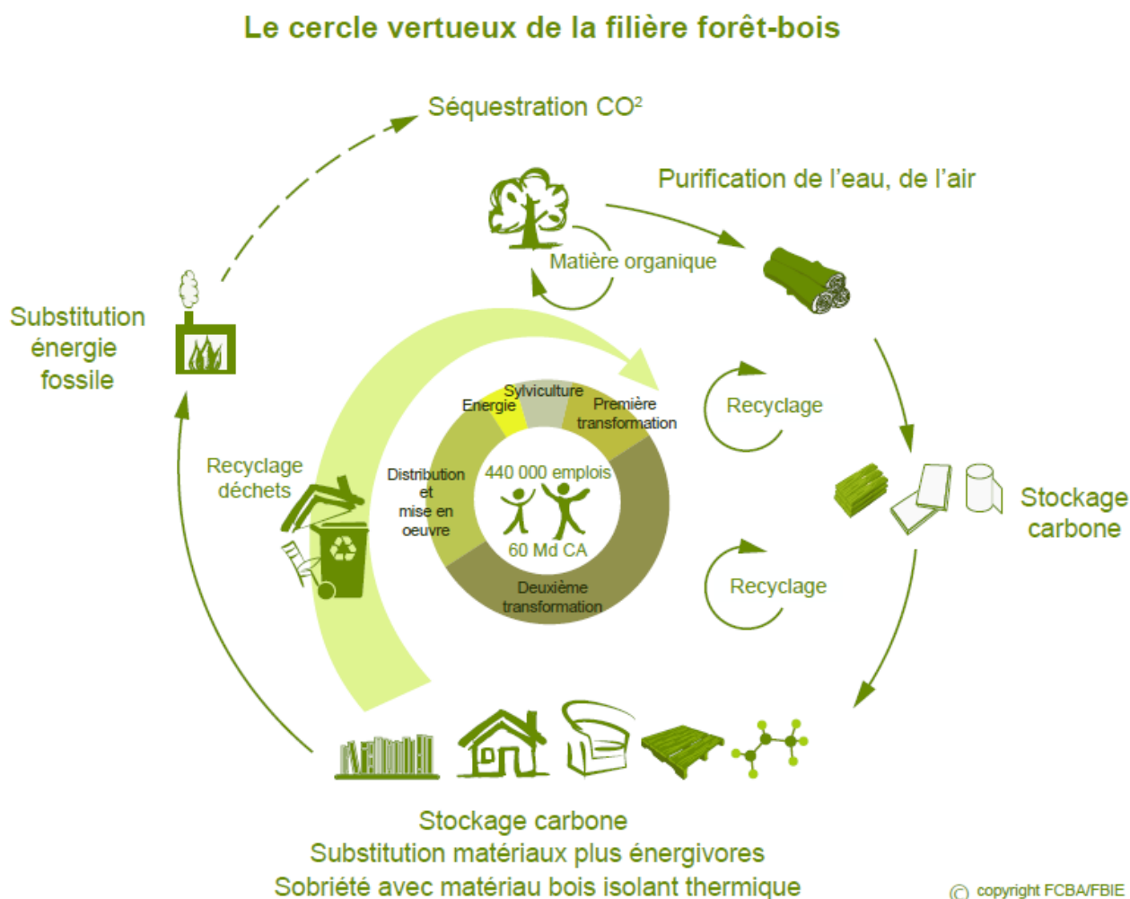
Figure 1. Cercle vertueux de la filière forêt-bois

Un des principaux outils de ce projet est la mise en œuvre d'un Fonds Forestier Stratégique Carbone (FFSC) . Celui-ci sera alimenté par 25% des montants annuels issus de la mise aux enchères des quotas carbone et aura pour but de financer des reboisements et des actions collectives (promotion, innovation).