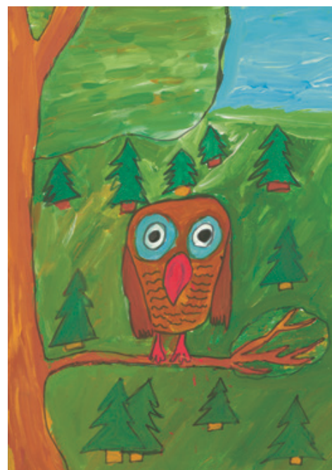
Ula I. 10 ans

Dans la forêt en hiver, seul le forestier est en vert.