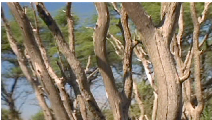
Figure 6. La Libertad de Lisandro Alonso (2001)

Nous laisserons Ernst Zürcher conclure par une belle question, fondamentale : « Est-ce que le chant des oiseaux ou le murmure d'un papillon sont, outre leur beauté, utiles à la vie des arbres voire totalement indispensables ? »