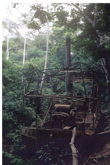
Figure 4. Fitzcarraldo de Werner Herzog (1982)

Qu'en est-il au cinéma ? Comment celui-ci a-t-il recueilli l'héritage de ces deux traditions parallèles ?