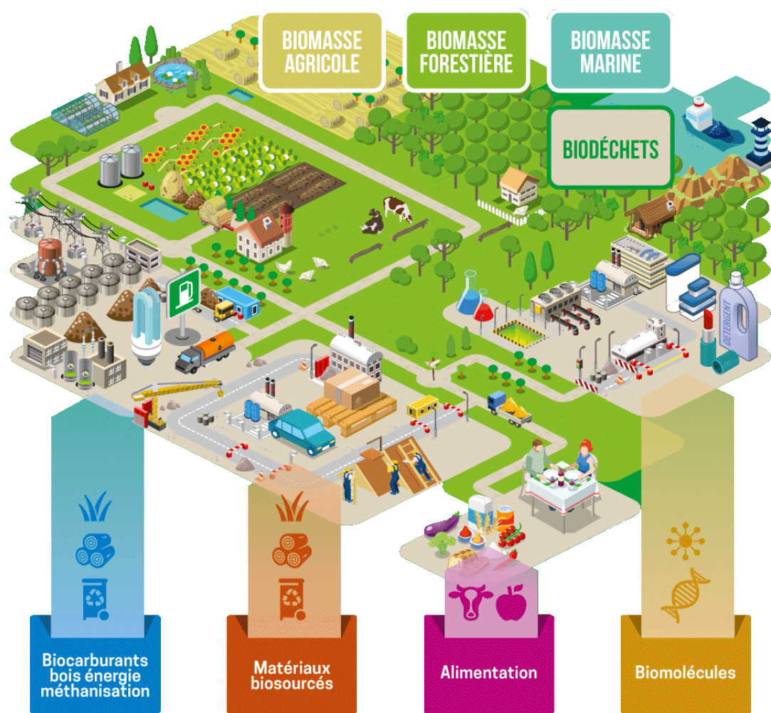
Figure 2. Le projet GAYA

Le projet FUTUROL (voie humide) s'étant achevé en 2017, l'usine de POMACLE BAZANCOURT (51) a trouvé acquéreur pour prolonger les essais sur 5 ans, en produisant à la fois des enzymes et de l'éthanol avancé. Le projet BIOtFUEL comporte un pilote situé à VENETTE (60), qui vise d'ici 2020 la production de biogazole et biokérozène de deuxième génération à partir de biomasse solide par voie Fischer –Tropsch et hydro-traitement (voie sèche).