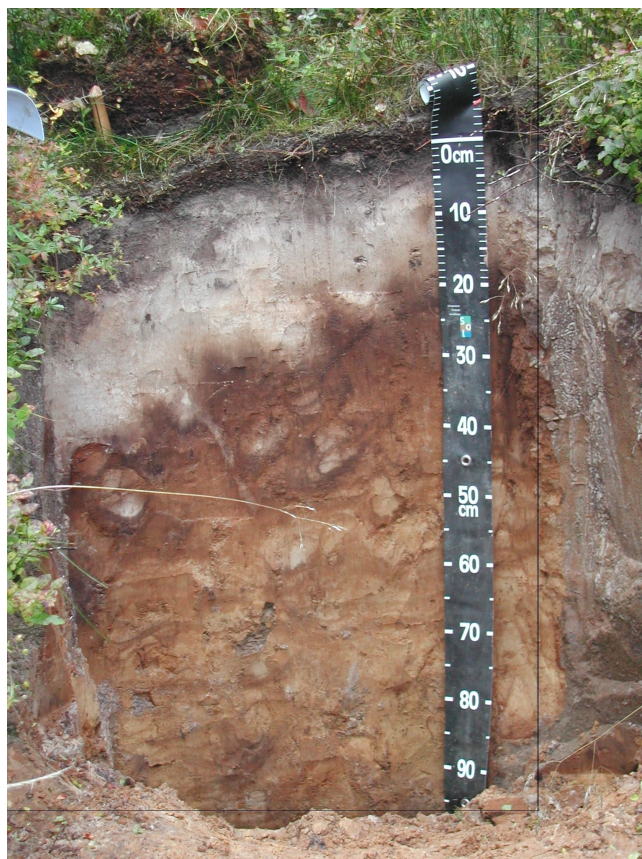
Figure 1. Sur ce profil de sol, on distingue nettement de haut en bas : un horizon noir de matière organique mal décomposée, un horizon blanc de sable très pauvre, une roche mère en blocs, colonisée par les racines des arbres.