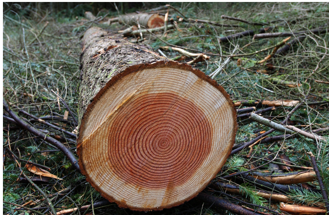
Figure 3. Bois de qualité : belle grume de douglas

Les objectifs du propriétaire dépendent des biens et services qu'il a choisi de produire de manière durable dans sa forêt ; son choix est un peu plus libre s'il est privé plutôt que public. Produire du bois et le valoriser économiquement reste l'objectif le plus fréquent de l'activité sylvicole, car c'est presque toujours le seul moyen de financer les autres services de la forêt. Lorsque l'environnement naturel et économique le local le permettent, la production de bois d'œuvre, feuillu ou résineux à plus forte valeur est recherchée. Dans le cas contraire ou pour les produits d'éclaircie, il peut s'agir de piquets, bois d'industrie, ou bois de feu. Préserver ou améliorer la biodiversité est un objectif possible pour des forêts situées dans des zones de protection identifiée (zone Natura 2000), ou appartenant à des associations de protection de la nature, à des particuliers à sensibilité écologique marquée, notamment dans le cadre d'éventuels contrats de préservation des milieux naturels et espèces rares.