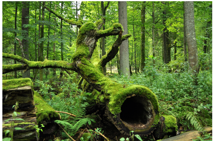
Figure 1. La forêt de Bialowieza en Pologne

En l'absence d'intervention humaine, les processus naturels à l'œuvre dans les écosystèmes forestiers liés à la croissance des arbres, ainsi qu'à leur reproduction et leur mortalité, leur permettent de se maintenir au fil du temps, même si leur composition et leur structure évoluent, en réponse à des changements de leur environnement, notamment du climat. On peut le constater dans des forêts où aucune gestion sylvicole n'a été pratiquée pendant des temps assez longs. Un bon exemple en est la forêt de Bialowieza en Pologne (cf. fig. 1). Les forêts n'ont donc pas besoin de l'homme pour se perpétuer. Mais