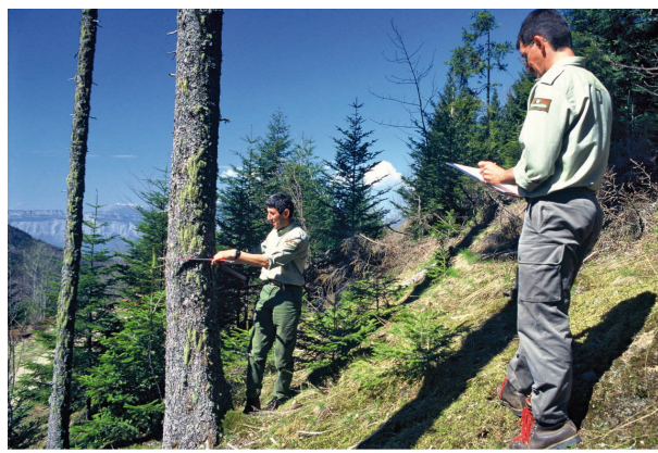
Figure 3. Agent et technicien forestiers

Le rôle des techniciens forestiers est d'aider les propriétaires forestiers privés et publics pour le renouvellement, la croissance et la bonne gestion de leurs peuplements forestiers. Selon le degré de délégation accordé par le propriétaire, l'agent de gestion forestière peut avoir en charge : 1) le conseil au propriétaire, dans le cadre des politiques forestières locales et nationales ; 2) l'élaboration et le suivi des documents de gestion forestière ; 3) la détermination des essences forestières les mieux adaptées aux sols ; 4) la programmation des travaux à réaliser (du boisement à la coupe définitive) ; 5) l'encadrement du travail des agents et opérateurs de sylviculture, pour travaux d'entretien, de plantations et d'entretien ; 6) l'organisation de la vente des bois, y compris la conduite du marquage des bois avant l'exploitation ; 7) le suivi de la bonne réalisation des coupes de récolte.