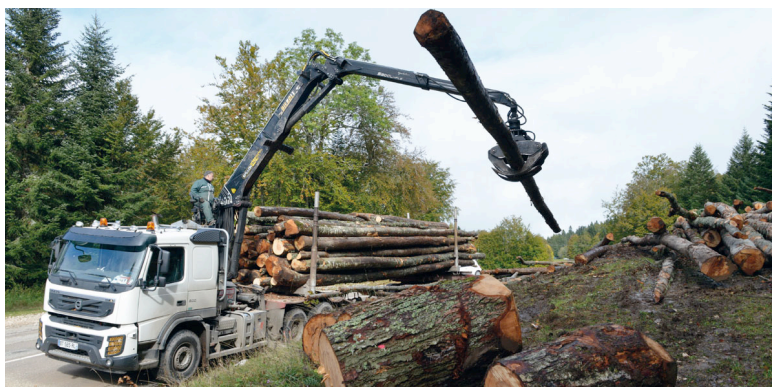
Figure 5. Chargement d'un camion en forêt

Le transporteur exerce un métier, qui bien que non véritablement forestier, diffère de celui du chauffeur routier classique, puisqu'il lui faut accéder à des places de dépôt en bordure de forêt, par des routes forestières souvent difficiles, procéder au chargement du camion avec sa propre grue, et enfin fiabiliser l'arrimage de son chargement, et respecter la charge autorisée.