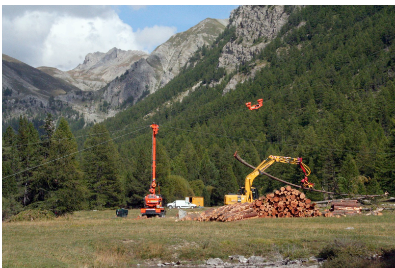
Figure 6. Exploitation par câble-mât en montagne