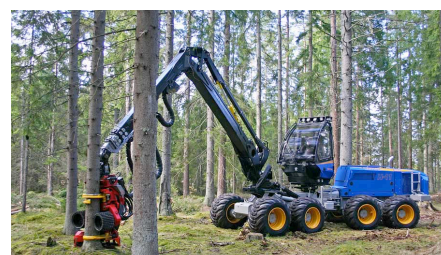
Figure 4. Abatteuse forestière

Le débardeur extrait les bois de la forêt et les dépose en un endroit où ils seront repris soit par un camion de transport, soit par un broyeur dans le cas de bois-énergie. L'essentiel des volumes débardés est fait par deux types d'engins très différents : 1) le débusqueur, ou skidder, gros tracteur articulé sur lequel sont montés des treuils enrouleurs de câbles ; le conducteur de l'engin vient se positionner près des bois à débarder, attache son câble autour des troncs, et les tire jusqu'en bordure de route ; 2) le porteur, qui est composé d'un tracteur articulé, d'une remorque (à 4 ou 8 roues motrices) et d'une grue télescopique permettant la manipulation et le chargement des bois. Le conducteur charge les bois sur la remorque, et va ensuite les décharger en bordure de route ou sur un camion. Schématiquement, le porteur est utilisé en terrains plats ou moyennement pentus, le skidder en terrains difficiles. Deux autres techniques sont aussi employées : le débardage par câble aérien, technique complexe et coûteuse, réservée aux forêts inaccessibles afin d'assurer la régénération de ces forêts âgées généralement en zones montagneuses, et le débardage au sol par mulet ou cheval, qui préserve mieux les sols, mais reste anecdotique en raison de son coût et de sa faible productivité. L'hélicoptère peut être une solution pour les cas extrêmes.