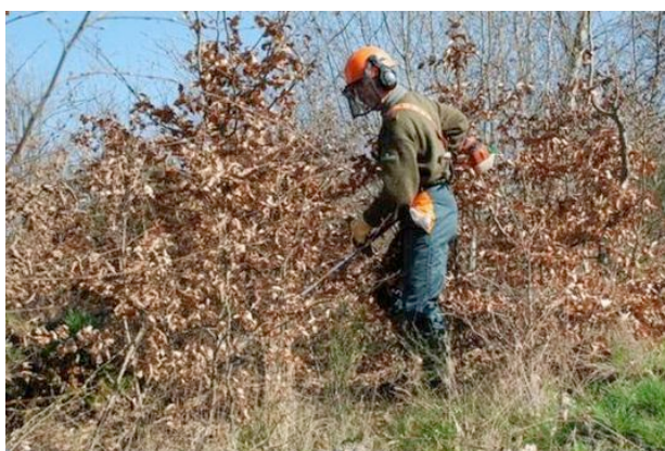
Figure 2. Ouvrier forestier dégagant une régénération

La mission des ingénieurs forestiers est variée : élaboration de plans de gestion ou aménagements, formulation de projets et préparation de leur budget, supervision des équipes qui effectuent les travaux d'équipement forestier ou le martelage des arbres (désignation des arbres avant la coupe), organisation de la commercialisation du bois, contribution à la protection de la faune et la flore ainsi qu'à l'entretien des forêts, etc. Les ingénieurs forestiers fonctionnaires sont employés par l'ONF pour la gestion des forêts publiques ou par les Ministère et autres établissements publics en charge des forêts ou de l'environnement. Les ingénieurs forestiers civils sont employés dans les coopératives forestières ou des établissements publics comme les Centres Régionaux de la Propriété Forestière.