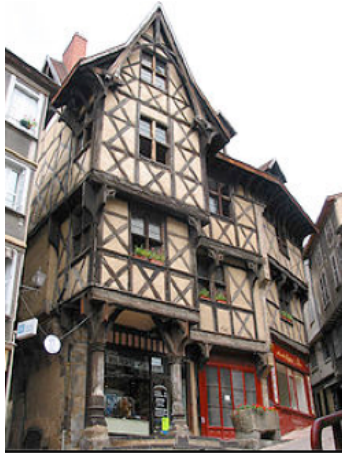
Figure 4. Hôtel Pirou à Thiers : en encorbellements

D'abord à un simple niveau les maisons vont devenir de plus en plus importantes et à étages. Les pans de bois longs initialement utilisés vont être remplacés par la technique des bois courts pour diverses raisons : raréfaction des bois longs en ville et difficultés de