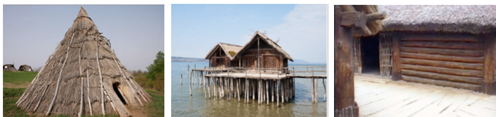
Figures 1., 2. et 3. Hutte préhistorique reconstituée ; maison sur pilotis ou palafitte ; maison faite de troncs empilés

Aux huttes des chasseurs cueilleurs du paléolithique, faites de bois, de végétaux, ou de peaux, dont les traces les plus anciennes connues remontent à 400 000 ans, aux habitats plus variés du néolithique (de – 9000 à – 3 300), allant jusqu'à l'habitat lacustre de type palafitte, succèdent les maisons faites de troncs d'arbres empilés à l'âge de bronze (- 1 100 av JC). Puis les techniques évoluent.