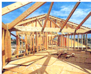
Figure 14. Maison à ossature bois (à gauche) et Figure 15. Maison bois à panneaux porteurs en sapin-épicéa, et exemple de panneau à gauche en pin (à droite)

iii) le souci de répondre à la demande, appuyé sur la diversification des modes constructifs bois pour la maison individuelle ou le collectif : maison à ossature bois (les parois sont en panneaux de particules accrochés à l'ossature, Fig 14) ou encore : maison en panneaux porteurs en bois massifs lamellés-aboutés-contrecollés, Fig 15.