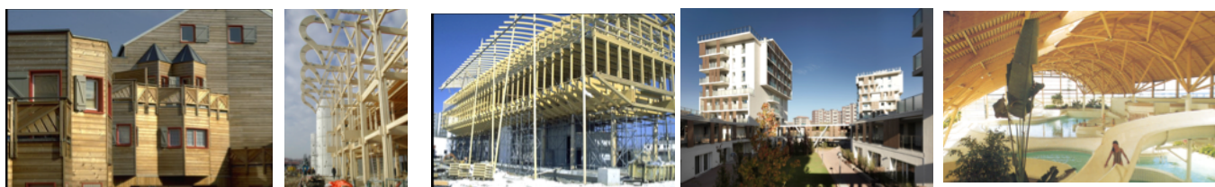
Figures 16 Logements collectifs à Aubervilliers - 17 Lycée de Mirecourt (Vosges) - 18 Institut Technologique FCBA Bordeaux - 19 Immeuble à Milan (bois caché) - 20 Centre nautique à Sète - 21 Pont routier (Crest, Drôme) - 22 Immeuble R+6 à Albertville

Les développements de ces nouvelles techniques et de ces nouveaux produits, favorisés par la sensibilité des consommateurs à l'environnement et à l'intérêt du bois en matière énergétique, conduisent à un réel développement de l'utilisation du bois dans la construction tant pour la structure que pour le second œuvre, comme le montrent quelques exemples ci-dessous.