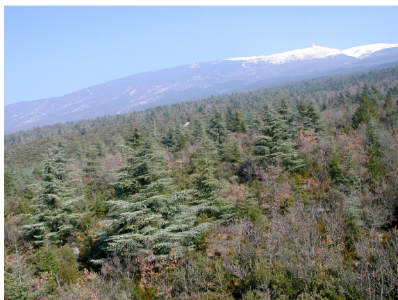
Figure 4. Exemple historique réussi de migration et gestion assistées : la gestion accompagne la dynamique naturelle du cèdre plus résistant aux CC sur les pentes Sud du Mont Ventoux (Vaucluse), après son introduction par plantation à la fin du XIXe siècle.