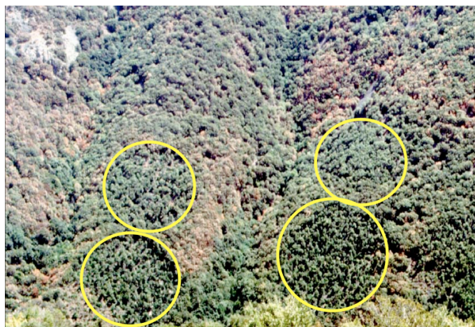
Figure 3. L'éclaircie expérimentale (parcelles circulaires) pratiquée dans un taillis de chêne vert en Catalogne fait apparaître en année sèche une meilleure résistance des zones traitées.

Il peut être intéressant à court terme d'avoir une population adaptée à des conditions locales bien définies, tandis qu'à long terme il s'agit de se préparer à faire face à des incertitudes sur les besoins adaptatifs futurs. Des compromis seront parfois nécessaires. Ainsi, on observe que les arbres ou les peuplements soumis à un stress régulier modéré récupèrent aussi plus rapidement lors de stress plus prononcés : dès lors, l'objectif ne sera pas toujours d'éliminer complètement le stress, mais parfois aussi simplement de le maintenir à un niveau acceptable pour malgré tout favoriser l'acclimatation. Autre exemple, on peut cibler à court terme certaines adaptations, alors qu'à long terme il est préférable de privilégier un niveau élevé de diversité.