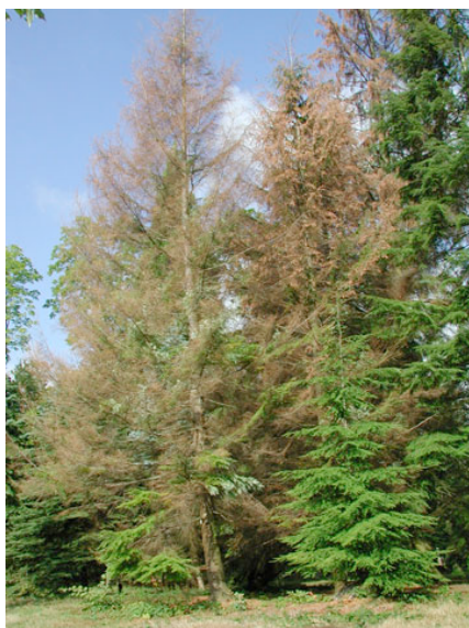
Figure 1. Mélèzes gravement affectés par la sécheresse

Le terme adaptation a plusieurs significations. Il peut désigner un état : celui d'une forêt, d'un individu ou d'un caractère ; il rend compte de l'adéquation d'un système biologique aux conditions environnementales à un instant donné. On dit par exemple qu'une population est adaptée à son environnement. Adaptation se dit également des processus écologiques et évolutifs sous-tendant l'ajustement de la réponse des êtres vivants, des populations et des écosystèmes avec les conditions extérieures et leurs évolutions. Enfin, ce terme peut signifier l'ensemble des actions anthropiques , comme la gestion et les politiques forestières, qui se fondent sur ces processus, pour améliorer et accélérer les ajustements des écosystèmes forestiers aux conditions nouvelles, et limiter leur vulnérabilité. C'est cette définition qui constitue l'objet de la présente fiche. Il faut aussi évoquer l' adaptabilité , c'est à dire la plus ou moins grande aptitude d'un système biologique à s'ajuster grâce aux processus évolutifs naturels.