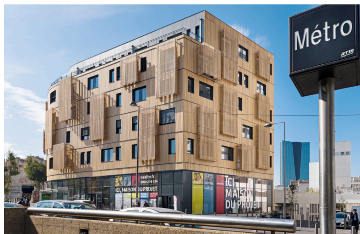
Figure 7. Immeuble de bureaux en bois de 5 étages à Marseille - Le système constructif est mixte : CLT (murs de façade et planchers) / poteau poutre de bois lamellé / noyaux béton - Source : CLT France

d) les panneaux à usage structurel (murs, planchers ou toiture) CLT (pour cross laminated timber ) : fabriqués sur mesure, ils sont composés de lames de bois massif croisées perpendiculairement (fig.6), et se présentent sous forme de panneaux de grandes dimensions (3,5 m en hauteur et de 15 à 20 m en longueur). Le nombre de plis varie en fonction des reprises de charges appliquées aux panneaux. Les éléments réalisés (toit, murs, planchers) permettent la construction de bâtiments allant de la maison individuelle à des immeubles de grande hauteur pouvant désormais atteindre 18 étages (fig.7et-8 en p. suivante-).