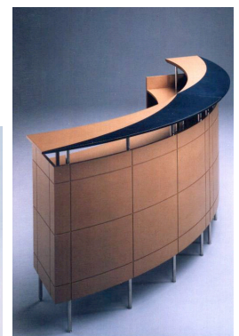
Figure 3. Panneau de particules (à gauche) et panneau MDF (au centre) ; agencement en MDF (à droite)