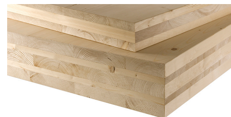
Figure 6. Panneaux CLT en 3 et 5 plis