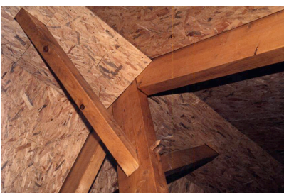
Figure 2. Panneau de contreplaqué (en haut) et panneau OSB (en bas)