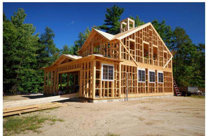
Figure 1. Maison à ossature bois

Il s'avère irremplaçable dans le domaine de la lutherie en « faisant chanter » les instruments. Son caractère renouvelable est en phase avec les préoccupations environnementales du moment et sa faculté d'être un puits de carbone ne peut qu'inciter à une utilisation accrue, raisonnée et maîtrisée. Le bois massif, avant toute chose, nécessite un séchage de qualité pour éviter les déformations ultérieures, fentes et autres imperfections qui nuisent à la solidité du matériau et à son esthétique. Ses caractéristiques mécaniques sont très différentes selon que les efforts s'exercent dans le sens du fil du bois (sens des fibres) ou perpendiculairement. Cette anisotropie, qui tient à la structure de sa paroi cellulaire, est un élément fort de différenciation par rapport à la grande majorité des bois reconstitués. Il est nécessaire d'en tenir compte pour les applications structurelles mais également lors d'opérations d'usinage. Un triage, lors des opérations de sciage, permet de détecter les éventuels défauts et de classer les bois débités selon des critères rigoureux normalisés. De récents dispositifs de détection des défauts et singularités du matériau, notamment des scanners, permettent un classement des bois selon leur aspect et leurs propriétés mécaniques.