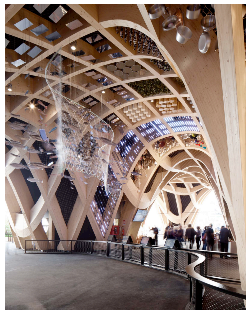
Figure 5. Une belle réalisation : le pavillon France à l'exposition universelle de Milan en 2015 (structure en lamellé-collé)

c) les poutres reconstituées : ce sont des éléments porteurs industrialisés, réalisés par collage structural soit d'éléments de petite section de bois massif, soit de placages obtenus par déroulage. Les lamellés collés, ainsi que les poutres en I (semelles en bois reconstitué et âme en OSB) permettent de réaliser des structures de grande portée appréciées pour leur aspect esthétique. De nombreux autres procédés récents (LVL, PSL, Parallam...) visent la même finalité (fig.4 et 5).