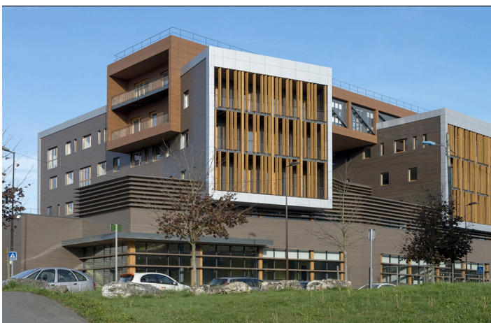
Figure 9. Le siège de l'Institut technologique FCBA à Champs-sur-Marne. Achevé en 2014, il combine le bois lamellé, l'ossature bois et le CLT.